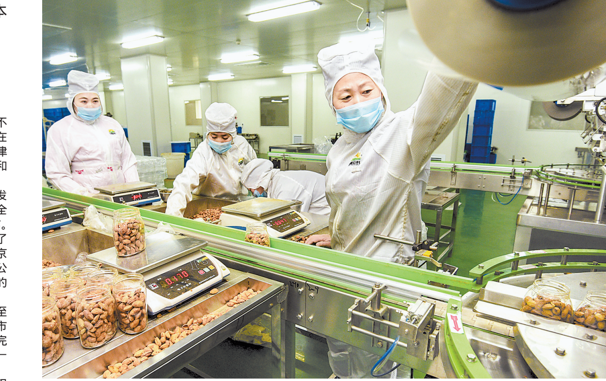
1月8日,在霸州市食品产业园一家干果生产企业,工人在包装干果产品。近年来,霸州市借助京津冀协同发展重大机遇,积极调整产业结构,大力发展都市食品产业。目前,入驻霸州市食品产业园的食品企业达35家,累计总投资超过120亿元。

京津冀交通一卡通的覆盖范围已不仅限于三地。目前,接入交通运输部一卡通系统的城市达190余个,在这些城市,京津冀互联互通卡同样可以正常刷卡消费。