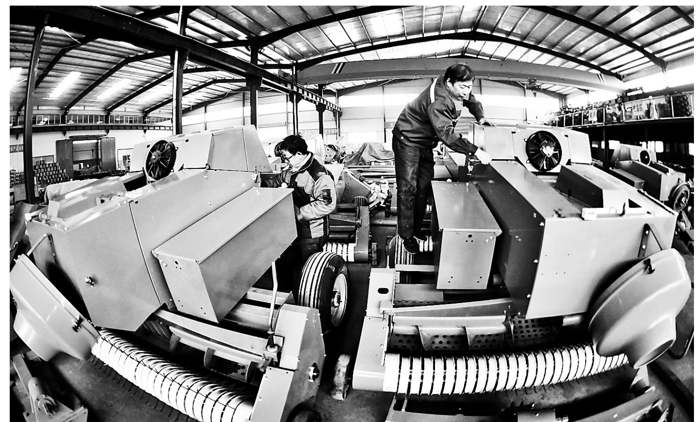
近日,高阳县庞口镇一家农机公司的质检员在检测待出口的农机产品。作为全国十大农机市场之一的高阳县庞口汽车农机配件市场,周边已形成13个农机配件加工专业村,拥有500多家生产企业,产品出口“一带一路”沿线20多个国家和地区,年产值20多亿元。

公开曝光,联合惩戒。实行失信被执行人全方位、立体化曝光平台和黑名单制度,通过报纸、互联网、微信、微博等,2018年公布失信被执行人自然人11624人次,法人、其他组织706人次。对拒不履行义务的被执行人依法采取查封、扣押、冻结、责令申报财产、拘留等强制措施。去年,发布限制高消费令3517人,对拒不执行起到了巨大的震慑作用。