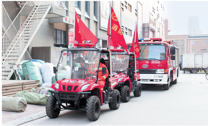
石家庄市南三条微型消防站配备的消防摩托车正在进行巡查。

据不完全统计,自2016年开始,石家庄市在全市铺开微型消防站建设后,已成功处置各类初期火灾100余起,挽救财产损失数百万元。