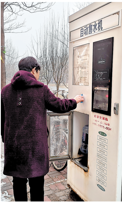
图为2月17日，石家庄市紫玉名苑小区的一位居民在用自助售水机买水。

以上卫生行政部门颁发的产品卫生许可证件，以及日常公示告知情况等。省卫健委综合监督执法局相关负责人表示，要保证售水机的水质安全，除了行业自律，还需要多个监管部门、社会监督等共同协作。