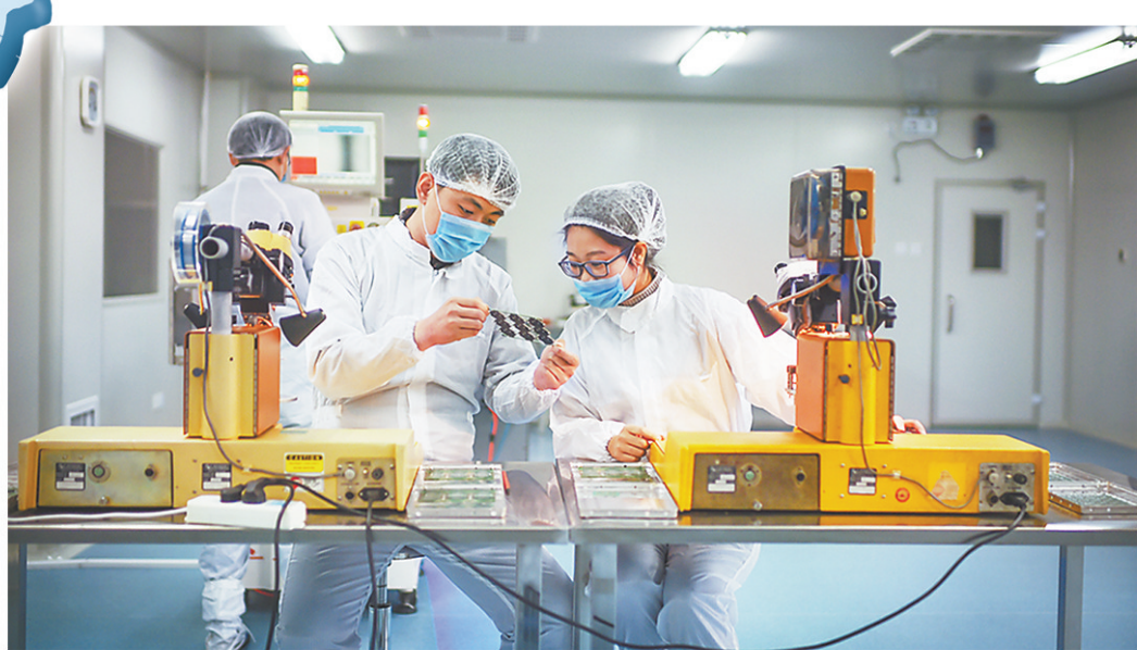
秦皇岛中纳川电子科技有限公司内,工人们正在生产汽车电压调节器芯片,该企业是由北京和秦皇岛两地院企共同成立的合资公司。