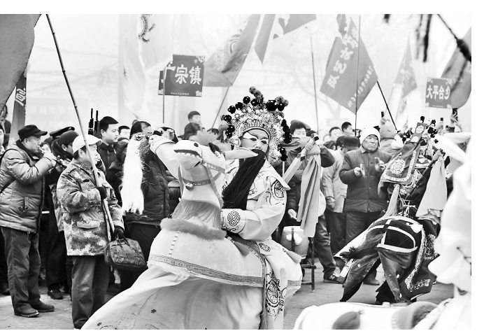
为丰富群众的文化生活,邢台市各地精心组织民间艺人赴乡村演出,为当地百姓奉上了一道道民间文化艺术大餐。这是日前民间艺人在广宗县民间艺术节上表演跑竹马。

本报讯(记者邢云 通讯员王培)及时清理草苫上的积雪,防止雨雪打湿草苫,压坏棚室,减少浇水次数,降低棚内湿度,适当增加草苫覆盖厚度,注意保温增温。前不久,一个早晨,裴建伟接到了农技员杨省格打来的电话。 裴建伟是任县大屯乡东许花村的蔬菜种植大户,他带领村民成立了任县建伟蔬菜种植专业合作社,目前发展蔬菜大棚100多个,有杨老师 一对一 的指导,我们种菜心里有底。