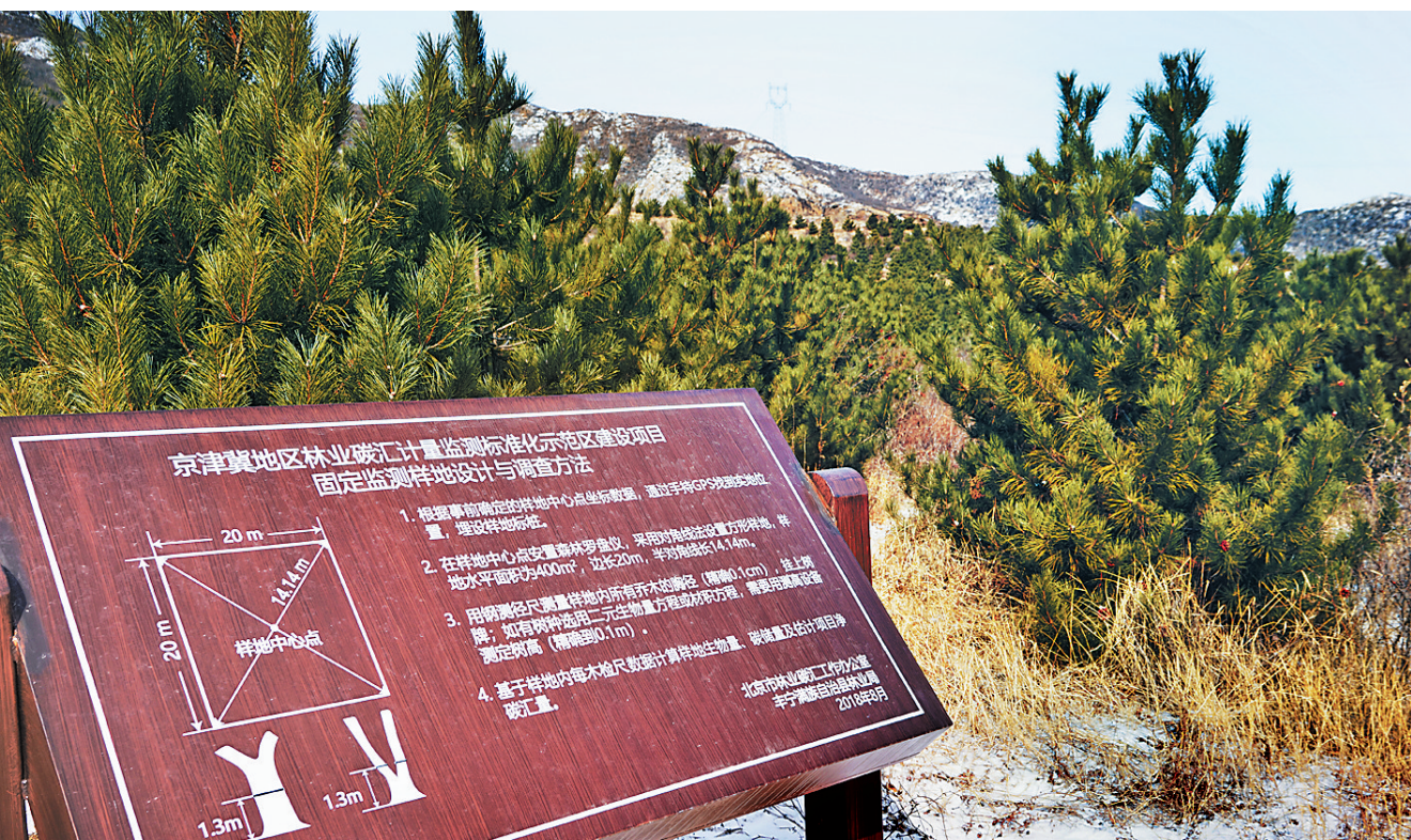
▲京津冀地区林业碳汇计量监测标准化示范区建设项目样地。