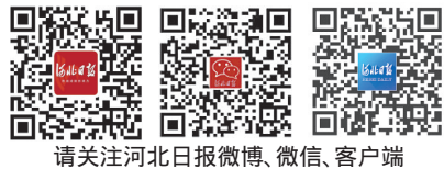
请关注河北日报微博、微信、客户端