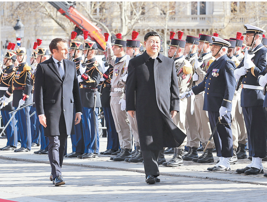
3月25日,国家主席习近平在巴黎爱丽舍宫同法国总统马克龙会谈。会谈前,马克龙在凯旋门为习近平举行隆重、盛大的欢迎仪式。