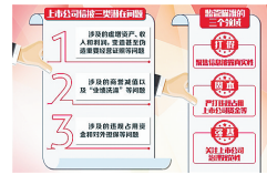
年报披露进入密集期 证监会强化监管防乌龙