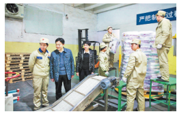
农行南和县支行 送金融产品进园区