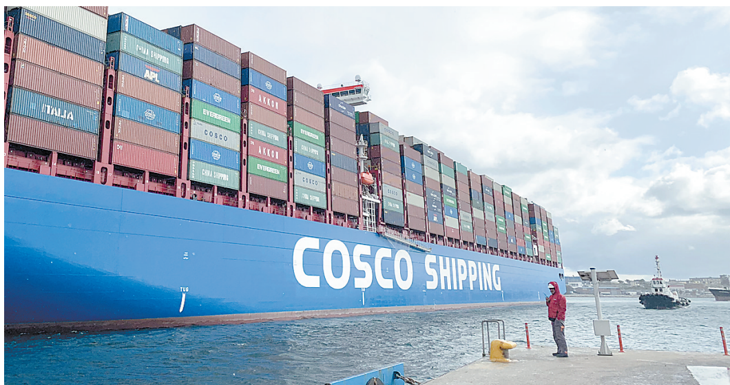
这是今年2月在希腊比雷埃夫斯港拍摄的中远海运双鱼座轮进港。5年多来，“一带一路”倡议在欧亚大陆落地生根，成为中欧战略合作新的增长点，也成为进一步拉近中欧关系、实现互惠共赢的重要纽带。

经过近6年的不懈努力，“一带一路”已转入落地生根、开花结果的全面推进阶段，面临着重大合作机遇