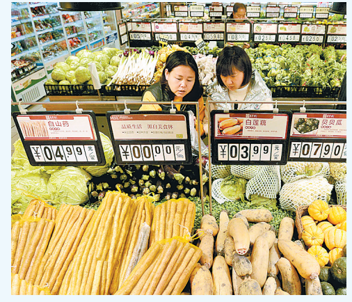
4月11日,顾客在邯郸市峰峰矿区一家超市选购蔬菜。

早教等服务供给有短板,流通环节效率较低、成本较高,信用体系不完善,市场秩序待规范,激活中国消费市场,仍需爬坡过坎。消费升级大趋势中存在诸多矛盾,要用改革的办法尽快化解。中国(海南)改革发展研究院院长迟福林说,比如降低教育、医疗、养老等成本,加大服务市场开放力度,突破供给严重不足的矛盾。老百姓钱袋子鼓起来,消费才能跑起来。记者从国家发改委了解到,相关部门将制定出台促进城乡居民收入合理增长的行动方案,研究提出扩大中等收入群体的中长期思路和政策举措,加强城乡居民增收形势和居民收入差距情况的跟踪分析。随着增加居民收入、改善消费环境、提升产品质量等一系列政策措施加快实施,中国消费潜力将进一步释放,中国经济大船在国际风浪中行稳致远的底气不断增强。国家发改委副主任宁吉喆说。据新华社北京4月11日电