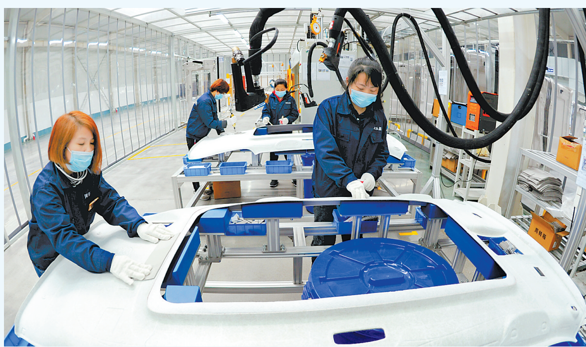
4月12日,文安县永昌汽车座椅有限公司新引进的汽车顶棚生产线项目投产。近年来,该县引导骨干企业加强与大型汽车生产企业合作,实现与整车生产的同步设计、同步开发,做大做强汽车配件产业。

具体看,17日白天,坝上地区晴转多云间阴,其他地区晴间多云,张家口、承德有偏北风4到6级,阵风7级,中南部平原地区有偏南风4到5级。17日夜到18日白天,保定、石家庄、邢台、邯郸晴转阴,其他地区晴间多云。保定、廊坊及以南地区有北到东北风4到6级,阵风7级,沿岸海域和沿海地区有东北风6到7级,阵风8级。18日夜到19日,西北部地区阴有阵雨或雷雨,中南部地区晴转多云,其他地区晴间多云。