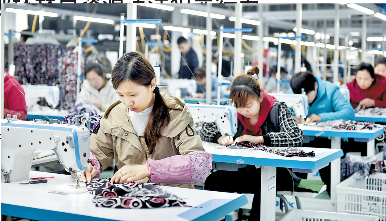
日前,位于南宮经济开发区的河北鸿熙服装股份有限公司的员工在加工时尚女装。该项目由北京西贝伦服饰集团投资1.1亿元建设,集高级成衣设计研发、生产、销售为一体,年产时尚女装80万件,产品销往全国各地。

日前,省林业和草原局专门成立了绿卫2019森林草原执法专项行动领导小组,并要求各市林业和草原主管部门抓紧成立专项行动领导小组和工作机构,结合实际制定方案,落实责任、分解任务、细化措施,切实将专项行动部署好、动员好、组织好,确保执法专项行动取得成效。