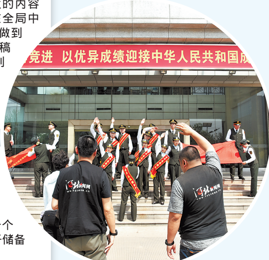
河北新闻记者在省高速公路管理局拍摄视频作品《赞赞新时代》。