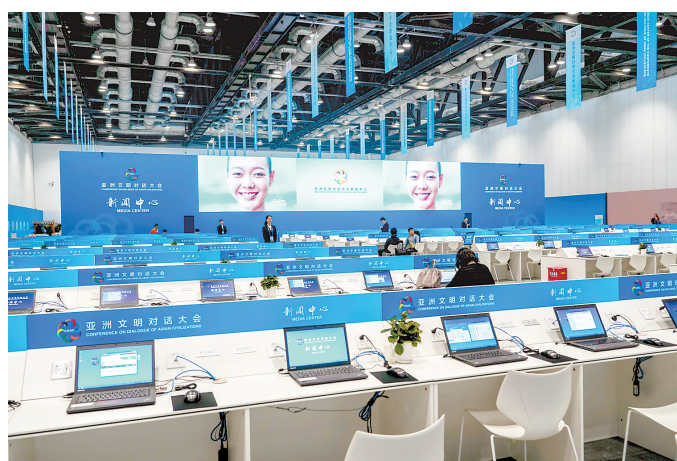
这是5月12日拍摄的新闻中心媒体公共工作区。当日，亚洲文明对话大会新闻中心开始试运营。据介绍，亚洲文明对话大会注册记者2900余人。其中，境外媒体记者380余人。

为共享亚洲的美食文化，亚洲美食节以“享亚洲美食，赏京城美景，品古都文化”为主题，在奥林匹克公园庆典广场设立美食节分会场，同期分别在国贸商城、蓝色港湾、合生汇、朝阳大悦城、金源购物中心、五棵松华熙6个商圈开展亚洲美食促销活动，展现中华美食文化的兼容并蓄，推动亚洲美食文明大发展、文化大交流、人民大联欢。