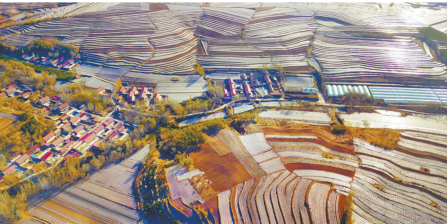
围场满族蒙古族自治县被誉为“中国马铃薯之乡”,日前当地农民种植的马铃薯田地呈现一派别样美景。其中,位于朝阳湾镇的马铃薯旱作梯田景色最美,每年都会吸引众多游客和摄影爱好者,成为当地乡村游的一张名片。 通讯员 孙占军 记者 陈宝云撰