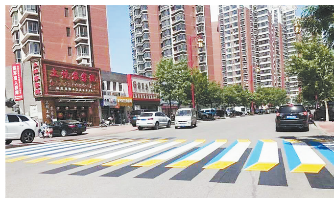
日前,一道3D斑马线亮相双滦区宝鼎小区附近路口。这道3D斑马线由双滦区美术家协会设计,所用材料为丙烯酸改性快干马路标志划线漆,采用白、黄、蓝、黑四色配合,在路面上产生立体效果,提醒过往车辆和行人注意交通安全。 通讯员 白子军 记者 陈宝云撰

容包括FLL机器人工程挑战赛、VEX机器人工程挑战赛、机器人综合技能比赛、机器人创意设计、教育机器人工程挑战赛。竞赛旨在激发青少年对工程和技术的兴趣,培养创新精神和团队合作能力,为全省青少年机器人爱好者搭建一个学习、交流及展示的平台,促进机器人教育活动的广泛开展,推动机器人科学技术知识的普及。本届竞赛吸引了全省10万名中小学生学习,共有428支队伍、1256名选手参加省级竞赛。