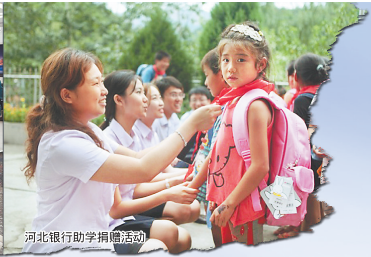
河北银行助学捐赠活动