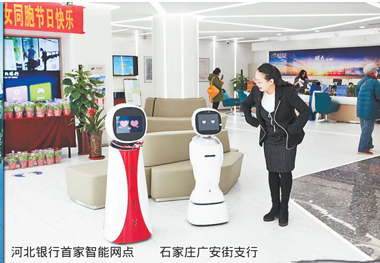
河北银行首家智能网点 石家庄广安街支行