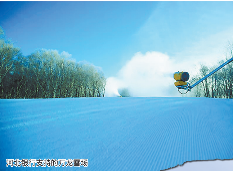
河北银行支持的万龙雪场