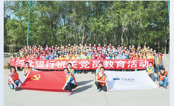
河北银行机关党员教育活动

深化人才兴行。坚持德才兼备、以德为先的选人用人导向，建立健全优秀年轻干部选拔、培养、使用及管理机制，多种形式多渠道发现选拔培养优秀年轻人才。目前全行正式在岗员工4753人，其中博士、硕士研究生663人，本科及以上学历占比79.09%，专业技术人员占比57.27%，为转型发展提供人力保障。