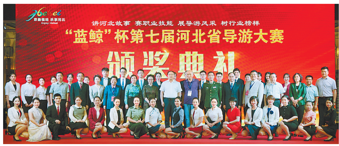
导游大赛强化了导游的职业认同感、荣誉感和自豪感。

导游是旅游服务和旅游形象的重要窗口,是传承和弘扬中华优秀传统文化和社会主义核心价值观的重要力量,也是提升旅游服务质量的关键因素。我省2.5万多名导游奋斗在旅游行业第一线,为提升河北旅游品牌形象、促进旅游对外交流、推动旅游业快速发展作出了积极贡献。我省历来高度重视导游队伍建设,不断创新导游