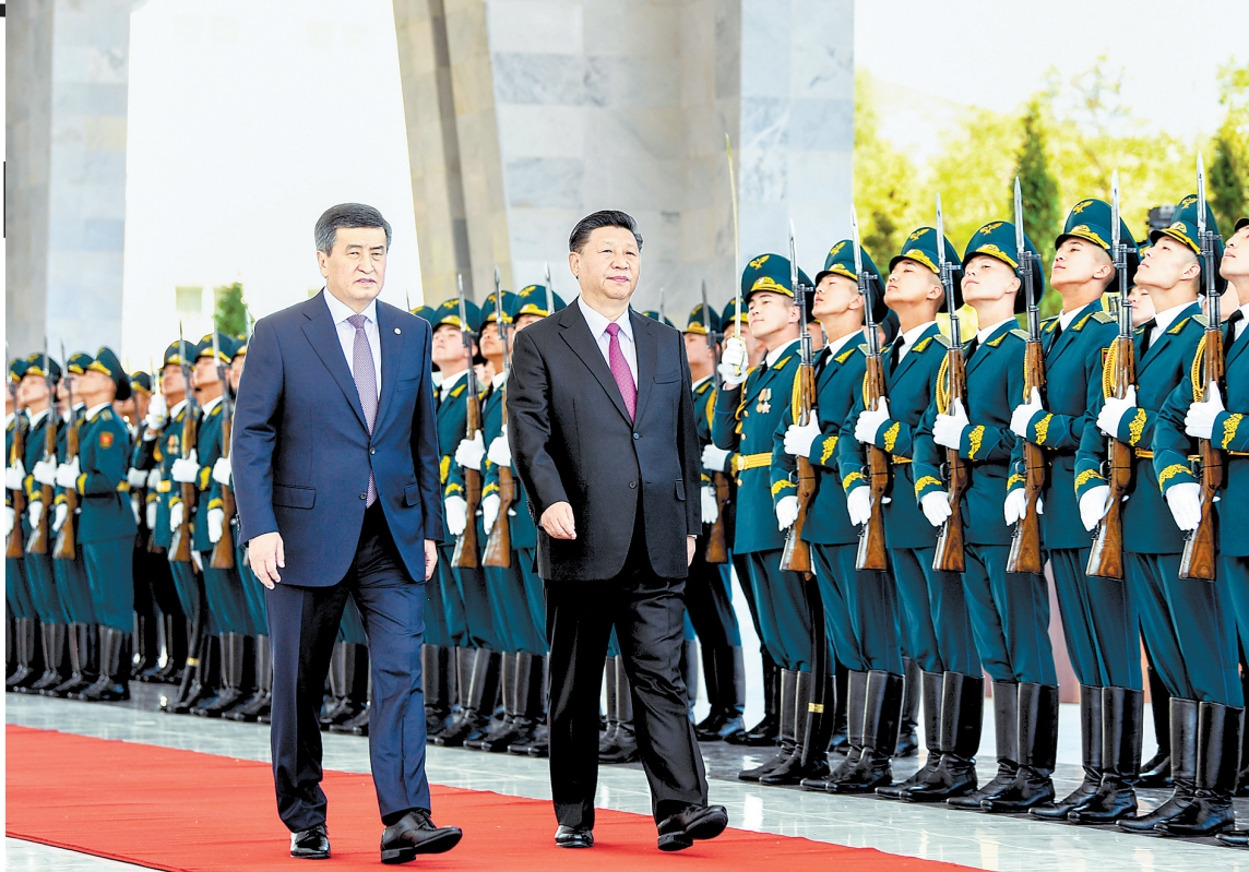
6月13日,国家主席习近平在比什凯克同吉尔吉斯斯坦总统热恩别科夫会谈。会谈前,热恩别科夫在阿拉尔恰国宾馆会议中心前广场为习近平举行隆重欢迎仪式。这是两国元首检阅仪仗队。