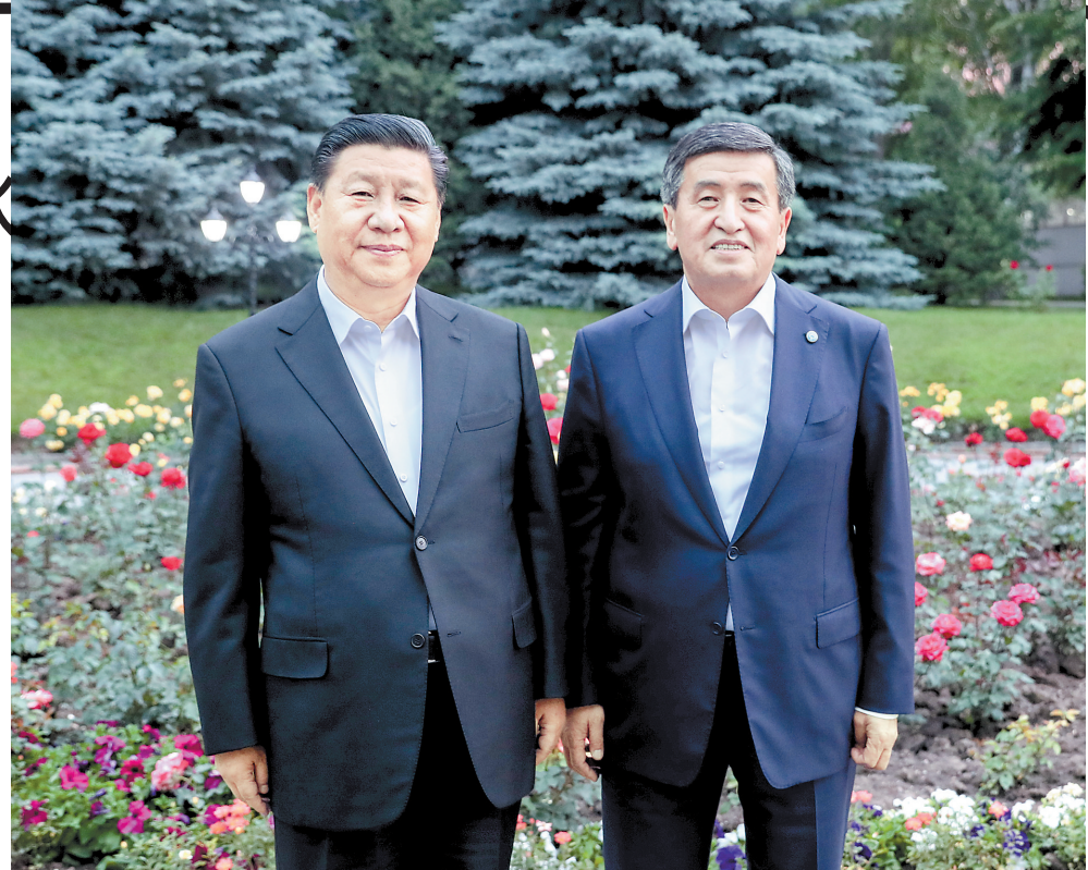
6月12日,甫抵比什凯克的国家主席习近平,应吉尔吉斯斯坦总统热恩别科夫邀请,来到总统官邸。两国元首亲切会见。

新华社比什凯克6月13日电(记者霍小光、李志晖、王申)国家主席习近平13日在比什凯克同吉尔吉斯斯坦总统热恩别科夫会谈。两国元首高度评价中吉关系发展和各领域合作成果,一致同意推动中吉全面战略伙伴关系迈上新台阶。