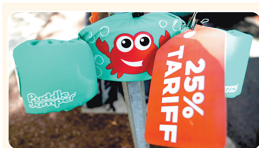
6月17日,在美国华盛顿,一件救生衣上挂着抗议加征关税的标语。