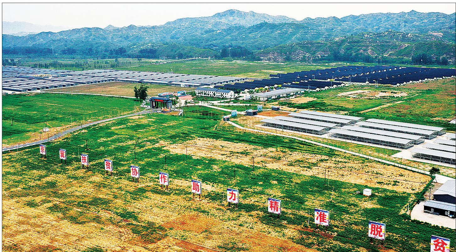
左图:坐落于青山绿水间的阜平晒鸽健康产业园区。