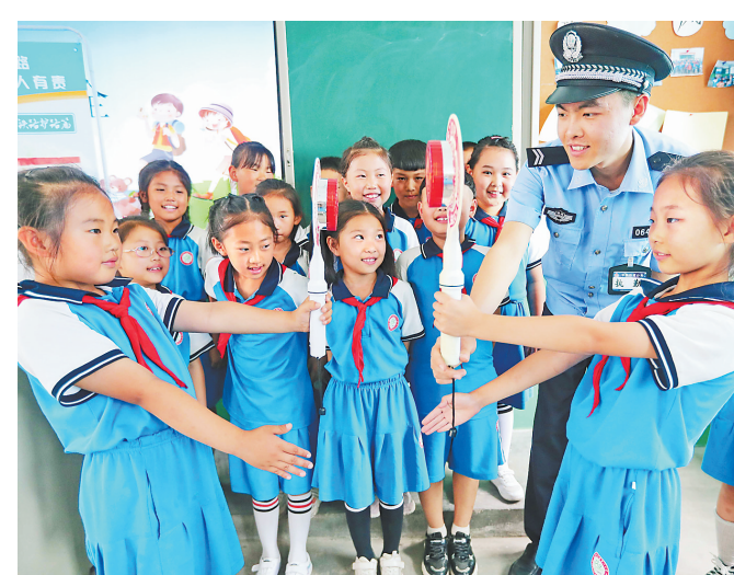
暑假将至,海港东区港镇第一小学联合太原铁路公安局秦皇岛分局开展假日安全小课堂活动,由铁路民警走进校园为学生讲解铁路交通安全法规、如何使用手持式停牌等铁路安全相关知识,教育学生养成不危害铁路安全的好习惯,安全愉快地度过暑假。这是日前民警指导小学生体验使用手持式停牌。

市纪委监委组织梳理、深入剖析党的十八大以来纪检监察干部违纪违法典型案例,编印《镜鉴》警示教育手册,全市1200余名纪检监察干部人手一本,用身边事教育身边人。同时加强对纪检监察干部八小时之外社交圈、生活圈、朋友圈的监督管理,一项项制度把对自身的监督螺栓一圈圈拧紧。