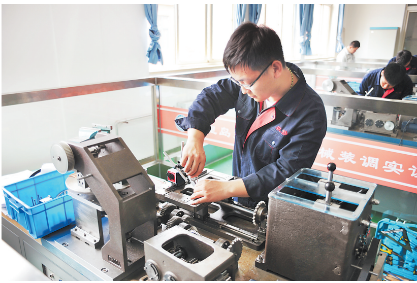
秦皇岛技师学院学生在上实践操作课。