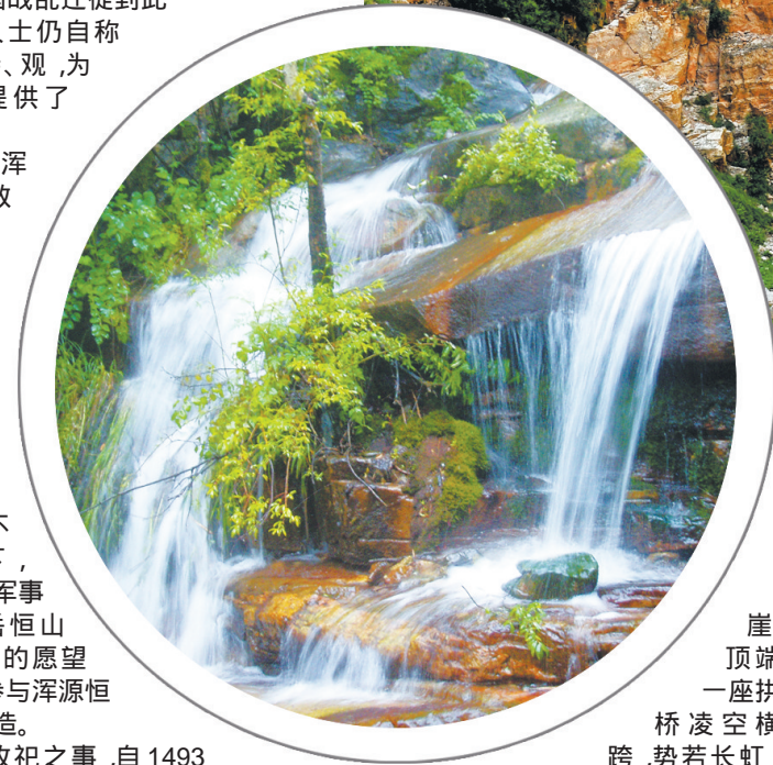
崖顶端一座拱桥凌空横跨,势若长虹。