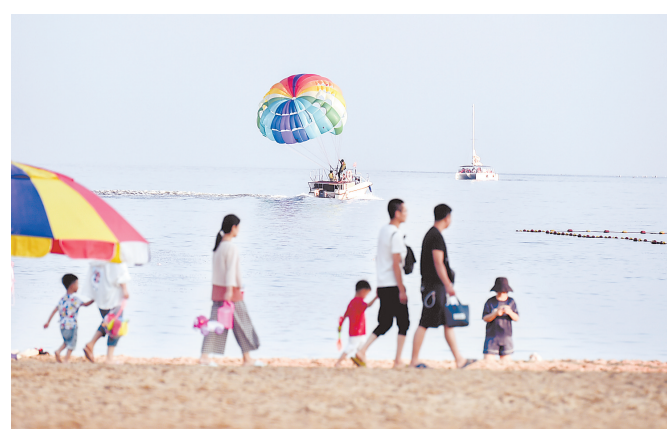
7月13日,游客在秦皇岛市金梦海湾游玩。近日,秦皇岛市各景区迎来旅游旺季。据介绍,截至6月底,仅山海关区旅游景区就接待游客188.65万人次,同比增长12.85%。

本报讯(记者潘文静 通讯员朱丽星)从河北航空获悉,7月17日,河北航空将正式开通石家庄至库尔勒航线。这也是河北航空继石家庄至乌鲁木齐航线后,在新疆开通的第二条航线,为便利河北、新疆两地交流提供了便利。 库尔勒市是新疆巴音郭楞蒙古自治州的首府,是南北疆重要的交通枢纽和物资集散地。河