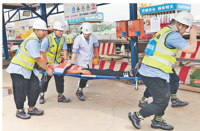
为防范化解重大风险、及时消除安全隐患,近日,廊坊开发区在只有红楼梦戏剧幻境项目现场举行了防触电应急救援演练活动。这是防触电应急救援演练活动现场。