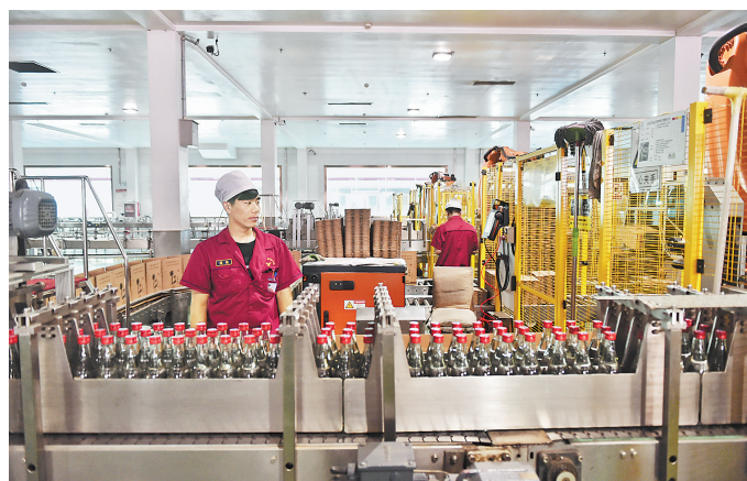
8月3日,在香河经济开发区新兴产业园内的北京一家食品企业生产基地内,工人在生产线上工作。该县抢抓京津冀协同发展机遇,目前已引进来自北京的各类企业100多家。

门要按照省委、省政府部署要求,大规模开展造林绿化,突出高速铁路和河流水系生态廊道,优选树种、合理布局、立体绿化,着力打造层次分明、四季多变的生态景观带,全面提升林业生态建设质量和水平。要坚持政府主导、市场化运作,大力发展经济林和林业产业,与农业种植结构调整、矿山治理修复等结合起来,有效调动社会力量参与,实现生态效益、经济效益、社会效益共赢。要建立健全造林绿化可持续发展体制机制,促进林业土地高效利用,保护好广大林农切身利益,进一步激发植绿、护绿、爱绿的积极性,确保高质量完成造林绿化任务。