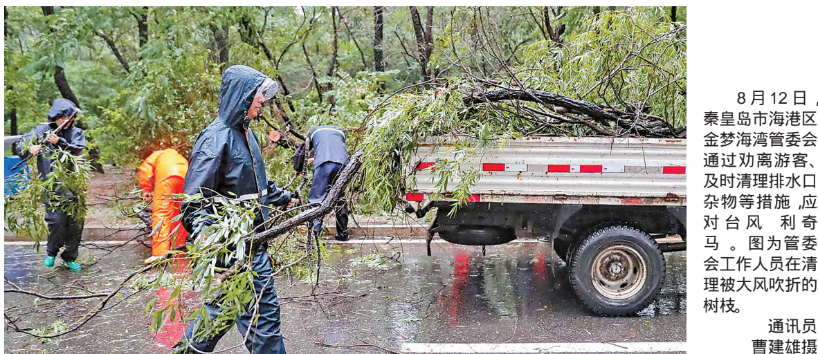
8月12日,秦皇岛市海港区金梦海湾管委会通过劝离游客、及时清理排水口杂物等措施,应对台风利奇马。图为管委会工作人员在清理被大风吹折的树枝。

守岗位,全力抢险救灾,保障市民的生命、财产安全。海港区园林局共出动人员130余人次、高架车15台次、货车28台次,处理倒伏乔木215株,确保了道路畅通和行人安全。