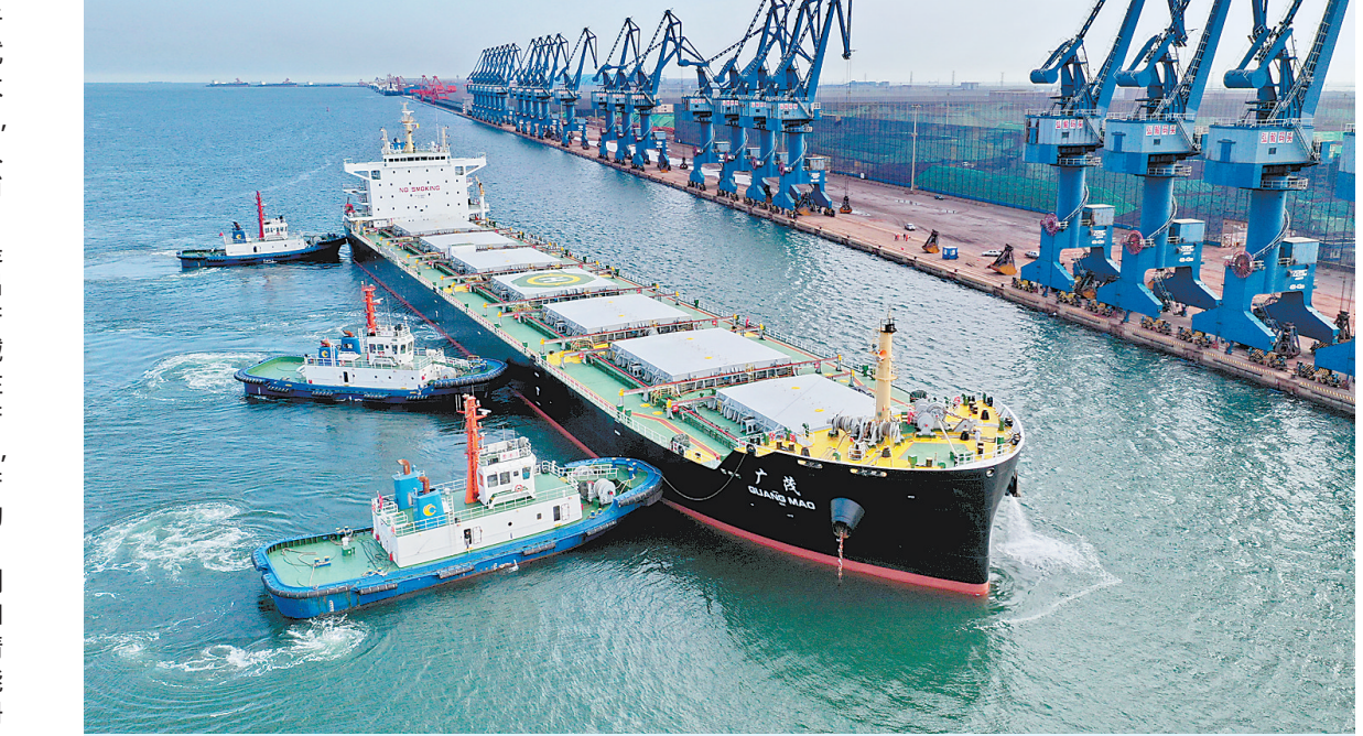
8月14日,一艘轮船在向曹妃甸港区弘毅码头靠泊(无人机拍摄)。记者从唐山市海洋口岸和港航管理局获悉,今年前7个月曹妃甸港区完成货物吞吐量19656万吨,同比增长6.93%。

本报讯(记者马彦铭)近日,国家药监局发布《关于扩大医疗器械注册人制度试点工作的通知》,进一步扩大医疗器械注册人制度试点,为全面实施医疗器械注册人制度进一步积累经验,我省被列入试点。 医疗器械注册人制度是指医疗器械注册申请人提出申请,其样品委托其他生产企业生产并获得《医疗器械注册证》后,成为注册人,注册人委托其他生产企业生产产品并以注册人名义上市,并对医疗器械全生命周期产品质量承担全部法律责任的制度。 实施医疗器械注册人制度,医疗器械的上市许可和生产许可解除捆绑,申请人可以委托具备相应生产能力的企业生产样品取得注册证,注册人可以将已获证产品委托给具备生产能力的一家或者多家企业生产产品。这将激发产业创新发展活力,优化创新资源的市场配置,促进高精尖医疗器械成果快速转化,促进委托生产的繁荣,突破土地资源和环境资源约束,推动我省医疗器械产业链上下游分工合作,推进我省医疗器械产业高质量发展。 从省药监局了解到,该局正抓紧制定我省医疗器械注册人制度试点工作实施方案。