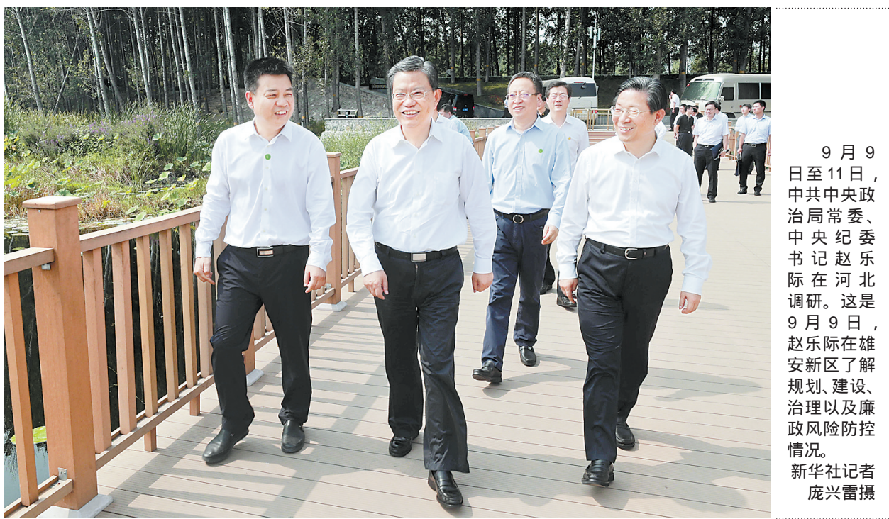
9月9日至11日,中共中央政治局常委、中央纪委书记赵乐际在河北调研。这是9月9日,赵乐际在雄安新区了解规划、建设、治理以及廉政风险防控情况。

赵乐际来到雄安新区规划展示中心,听取雄安新区整体规划和纪检监察工作情况介绍,他指出,雄安新区的规划、建设、治理,都要把廉洁理念贯穿始终,加强全过程监督,创新监督方式方法,有效防控廉政风险,确保建成阳光工程、廉洁雄安。在石家庄市鹿泉区违建别墅整治现场,赵乐际详细了解查处违建责任问题、腐败问题、作风问题情况,要求严格执纪执法,确保整治到位,同时加强警示教育,以案促改、举一反三,堵塞漏洞。赵乐际来到曲阳县王家屯村、柳树沟村和君乐宝乳业集团,进村入户走访慰问农民群众,面对面与基层干部群众交流,了解产业发展、脱贫攻坚、基层廉政建设和干部作风等情况,认真听取意见建议,强调要结合第二批“不忘初心、牢记使命”主题教育,持续整治群众身边腐败和作风问题,持续严惩扶贫民生领域腐败、涉黑腐败及“保护伞”,强化基层监督,完善制度机制,让基层干部明底