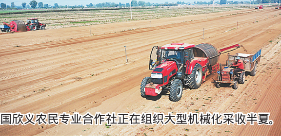
安国欣义农民专业合作社正在组织大型机械化采收半夏。