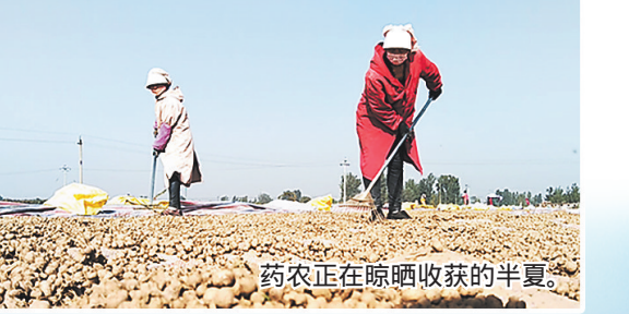
药农正在晾晒收获的半夏。