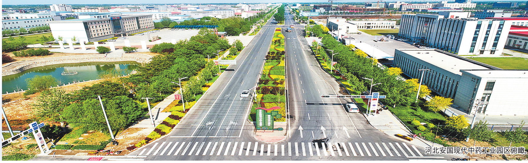
河北安国现代中药工业园区俯瞰。