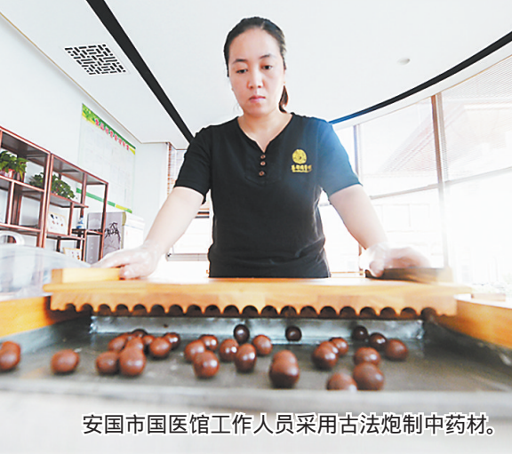
安国市国医馆工作人员采用古法炮制中药材。