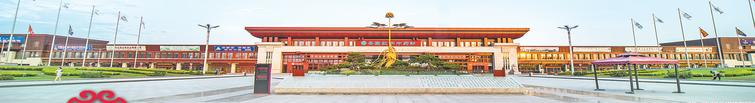
安国数字中药都正门。

安国，因药而立、因药而兴，是中药文化的发祥地之一，素有“药都”“天下第一药市”之称，享有“草到安国方成药，药经祁州始生香”之美誉。从传统交易到数字化平台、从中药到中医药再到中医药+的发展思路的转变，安国市在改革发展中全力奋进，在创新创业中不断前行。不忘初心、牢记使命主题教育开展让这座药香四溢的城市再次焕发生机，安国正在绘就国家级现代中医药产业创新聚集之都的精彩画卷。