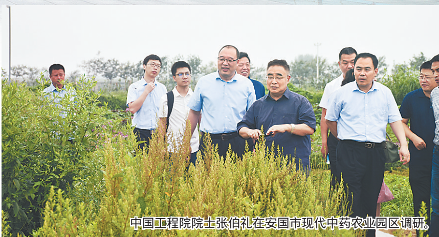
中国工程院院士张伯礼在安国市现代中药农业园区调研。

同时，该市坚持引智聚智促创新，与中国中医科学院、天津中医药大学、浙江大学、澳门大学、澳门科技大学等知名院校不断加强合作，主导成立了京津冀协同发展中药产业创新战略联盟，建立金木院士工作站、中药质量研究国家重点实验室、河北省中药发展技术研究院、无公害中药材研究院等一批中医药产业创新平台，中医药产业的科技创新、产品研发、科技成果转化能力得到明显提升，产业链向高端稳步延伸。