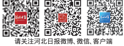
请关注河北日报微博、微信、客户端