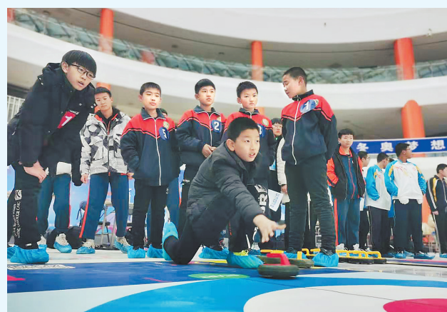
运动员在进行陆地冰壶项目的比赛。

本报讯(记者焦磊)近日,衡水首届冰雪运动会举办,来自各县市区的5000余名运动员和冰雪爱好者一同感受冰雪运动带来的别样魅力。