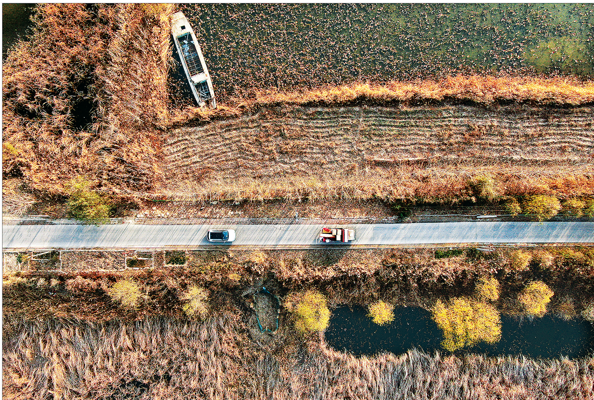
上图:11月28日 搬家的车辆驶过顺民庄村通岛路。