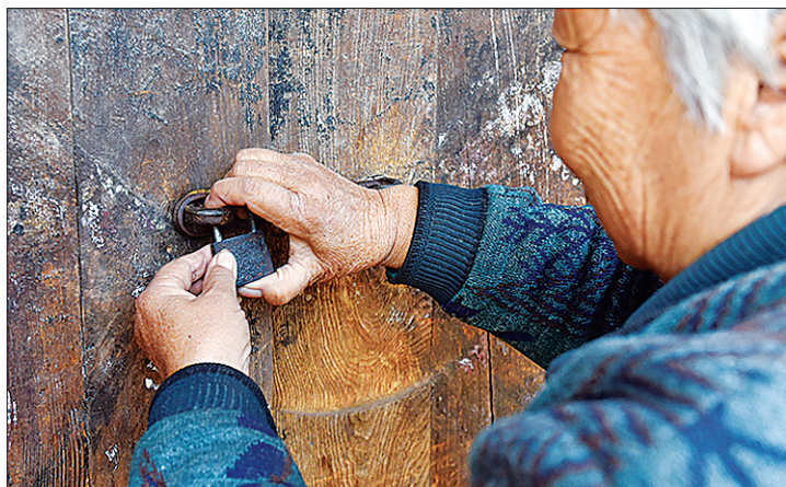
11月28日 准备搬离顺民庄村的村民锁上老宅。