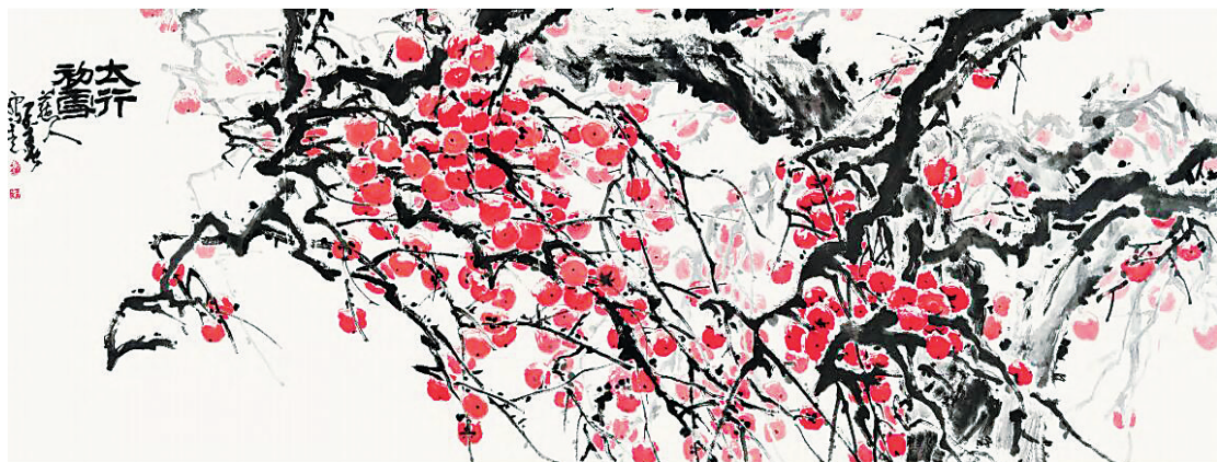
太行初雪(国画) 张子春

中国画在改革开放四十年间发生的变革,无疑是历史性的。其大跨度的历史性变革,不仅使水墨传统获得了全球化视野的艺术观照,水墨艺术由此已成为当下国际艺术流行的一种东方文化媒介,而且也在传统的不断回归中进行了现代视觉经验的审美转换与探索。回望中国画变革与发展的这四十年,其历程亦无不充满了论辩的激烈与选择的焦虑,从穷途末路的文化虚无到全方位观照的积极应对,从笔墨等于零的水墨概念拓展到守住中国画底限的笔墨文化坚守,中国画的发展似乎总是在冲击与回归、革新与反弹中跋涉前行。历史的回望让人们骤然醒悟,变革与回归是中国画发展始终存在的两种角力,缺一不可,变革的动力其实是靠不断的回归来作为支撑点的。譬如,二十世纪八十年代中期,因西方现代主义艺术思潮的能量积聚而对传统中国画形成穷途末路论的文化质疑,就是中国画在六七十年代遭受批判于新时期之初获得解放并再度置入西方现代主义横向比较的结果。显然,一大批受到不公正待遇的老画家的复出与中国画传统受到肯定的文化地位,才让更年轻的画家在传统的基础上开始了新一轮的路途探寻;而没有这个传统的复兴,也便不可能生成一种新的变革危机。从今天的角度看,每一轮变革的尾声,似乎也都以传统的回归与复兴为新的起点。这也便构成了中国画变革与复兴的轮回现象。这或许表明,复兴与变革都具有同等艺术史的展延价值,这便是在翻阅张子春的这部画集时,不断被其画作的大写意笔墨所唤起的一种审美感受。感染笔者的,显然不是他的画作如