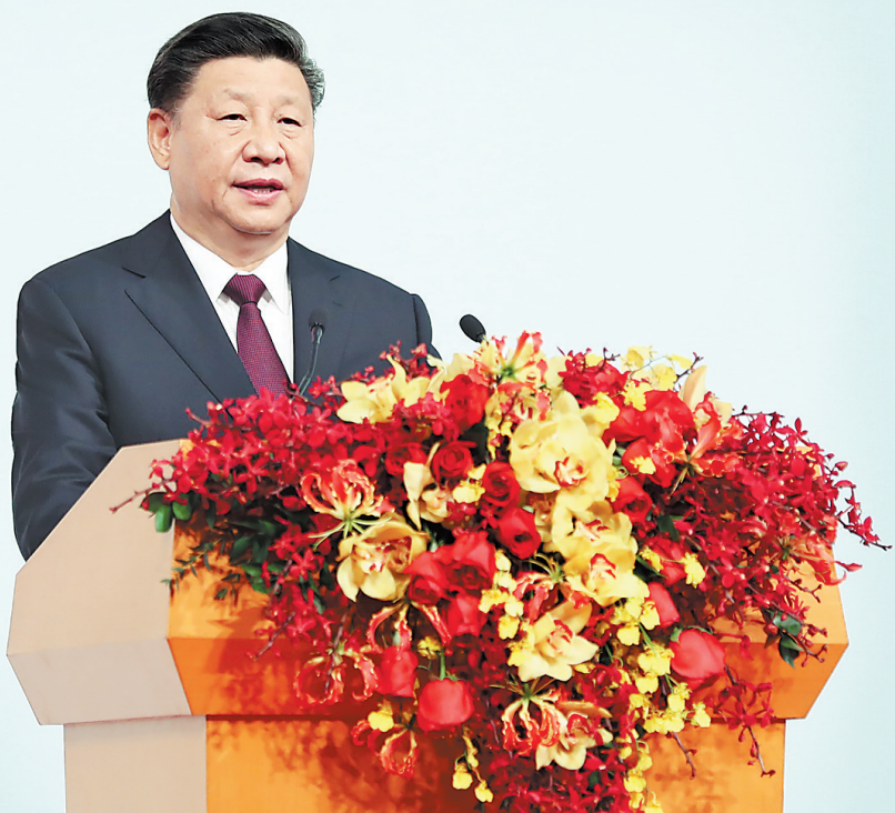
12月20日,庆祝澳门回归祖国20周年大会暨澳门特别行政区第五届政府就职典礼在澳门东亚运动会体育馆隆重举行。中共中央总书记、国家主席、中央军委主席习近平出席并发表重要讲话。新华社记者 鞠鹏摄

习近平指出,澳门回归祖国20年来,澳门特别行政区政府和社会各界人士同心协力,开创了澳门历史上最好的发展局面,谱写了具有澳门特色的一国两制成功实践的华彩篇章。他希望澳门特别行政区新一届政府和社会各界人士站高望远、居安思危,守正创新、务实有为,在已有成就的基础上推动澳门特别行政区各项建设事业跃上新台阶。