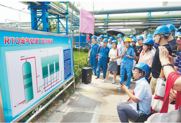
7月24日,在爱诺公司召开的石家庄市生态环境局关于农兽药行业涉voc行业试点工作现场会,其中参观公司的环保设备是议程里最重要的一个环节。图为在RTO设备旁讲解设备工艺流程。