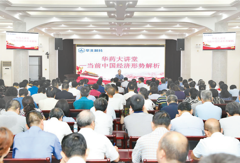
华药大讲堂解析当前中国经济形势。

水滴石穿,功在不舍。八年间,华药大讲堂不间断地宣讲培训,在企业中营造了勤学、善思、敢为的氛围,大讲堂的品牌示范效应不断得以放大。从领导班子到中层干部再到基层单位甚至班组,学习的触角传递到了企业的“神经末梢”。各子分公司纷纷创建了形式多样的基层讲堂,构建起多级联动、形式多样、全面覆盖的“大讲堂”体系。华诺公司通过开展“会议送学”“媒体送学”“网络送学”等形式,把学习教育与生产经营深度融合。新制剂厂为破解发展瓶颈,全面提升各级职工素质,搭建了“新制剂厂”系统培训平台。爱诺公司大力实施职工素质提升工程,引入知识竞赛、沙龙论坛、开办职工阅览室、给职工送书等创新的培训形