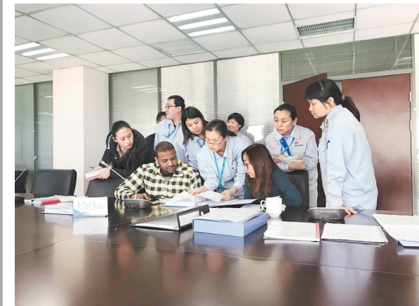
华药正在接受国际高端认证。