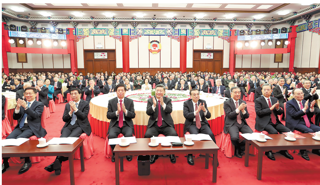
12月31日,全国政协在北京举行新年茶话会。党和国家领导人习近平、李克强、栗战书、汪洋、王沪宁、赵乐际、韩正、王岐山出席茶话会并观看演出。