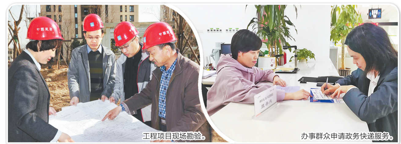
工程项目现场勘验。

念,将先进经验做法与工作实际相结合,推出了系列“廊坊版”改革举措。2019年全年开展了两期全市行政审批系统集中培训,20余次业务技能和能力素质专题讲座,定期开展科长讲业务。通过系统的培训学习,进一步提升全市行政审批队伍综合素质和业务技能,为优化营商环境、打造审批和政务服务新高地提供有力的人才和智力支撑。