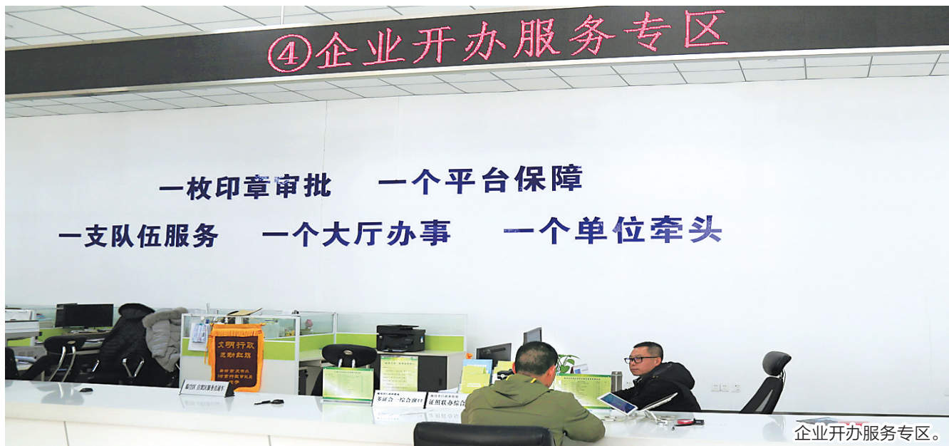
企业开办服务专区。

2018年以来,廊坊市公共资源交易全面实现电子化。运行不见面开标大厅,投标人可进行投标文件在线解密、在线质疑、在线回复等操作。截至目前,已有12项政府采购项目运用不见面开标大厅开标。投入使用电子档案系统,将项目进场交易活动有关的所有活动记录,整合在电子档案中,永久保存。全面应用“廊坊公共资源”手机APP移动办公平台,工作人员可实行“远程办公”,企业实现“移动申办”,更快捷更高效。全面推开远程异地评标,实现廊坊市电子交易系统远程异地评标功能全覆盖,评标工作由“人工跑”变“网络跑”。