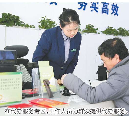
在代办服务专区,工作人员为群众提供代办服务。