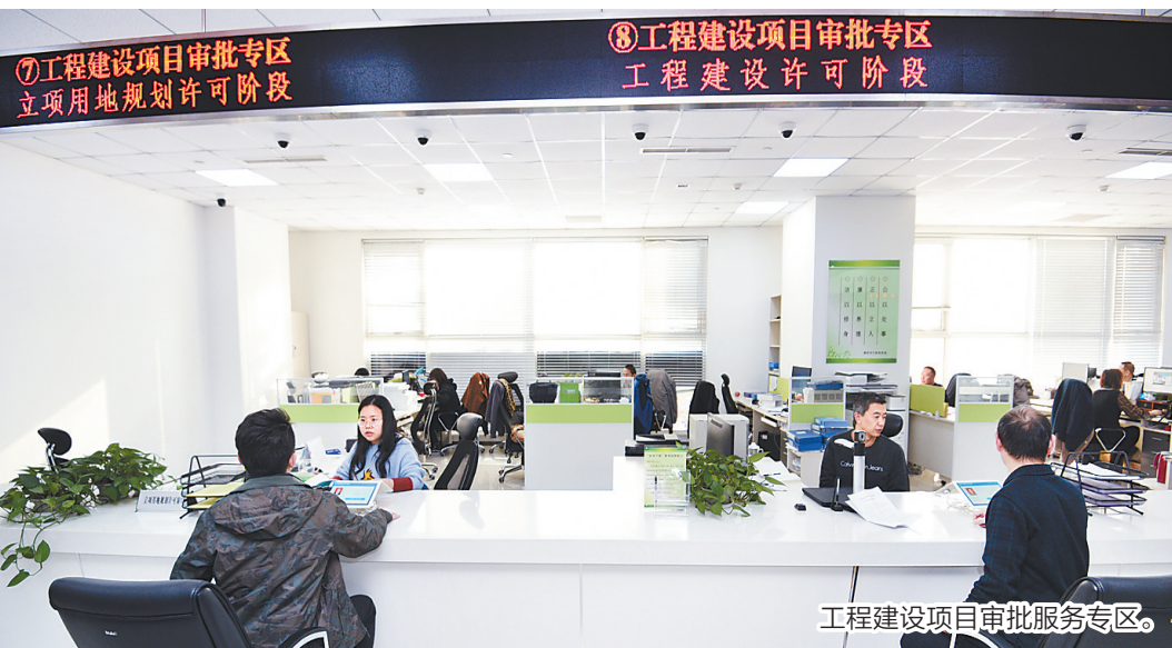
工程建设项目审批服务专区。

“互联网+政务专递”的“一键送达”——为打通企业和群众办事“最后一公里”,该局将政务服务平台与特快专递进行有机结合,全面推出“互联网+政务专递”便民服务。办事取证由“上门取”变为“送上门”。“互联网+行政审批+政务专递”一体化模式,真正实现“一次不用跑”。