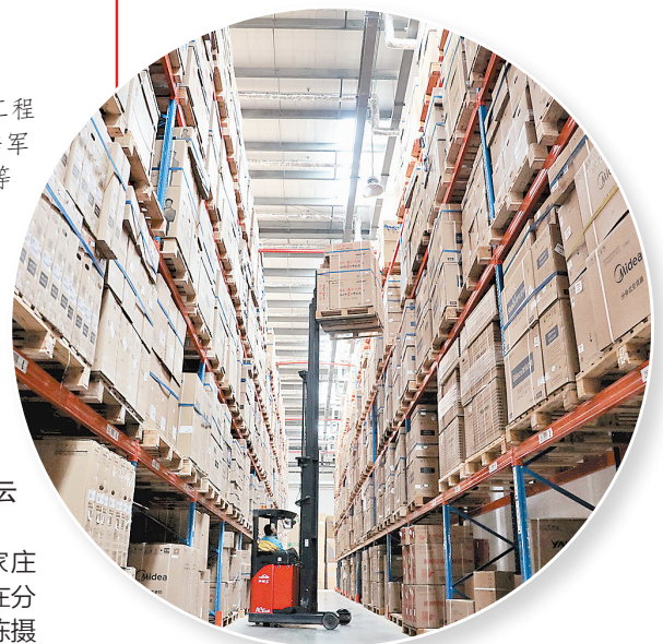
▶2019年11月11日,在位于石家庄市藁城区的苏宁物流中心,工作人员正在分拣商品。(本报资料片) 通讯员 梁子栋摄