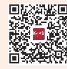
河北日报记者 赵海江 马彦铭 吴晓萌 摄制

针对上班后在食堂或是外出用餐的人群,程滢建议,尽量缩短就餐时间,用餐时少交流、少讲话。