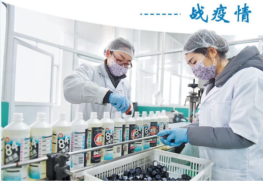
2月14日,北京龙安医学技术开发公司威县分公司员工加班加点生产消毒液,增加市场供应。

示精神,认真落实党中央和省委省政府决策部署,落实王东峰书记要求,抓实抓细防控措施,严防疫情扩散蔓延。赵一德来到临漳县京港澳高速邯郸出口检查站、回漳村、邯郸华府小区。(下转第三版)