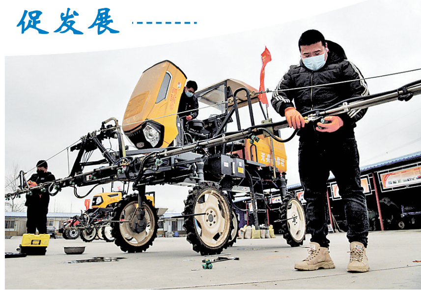
近日,石家庄市栾城区天亮种植专业合作社,在做好科学防控疫情的同时,开展农业机械保养、调试、检修,确保春耕生产。