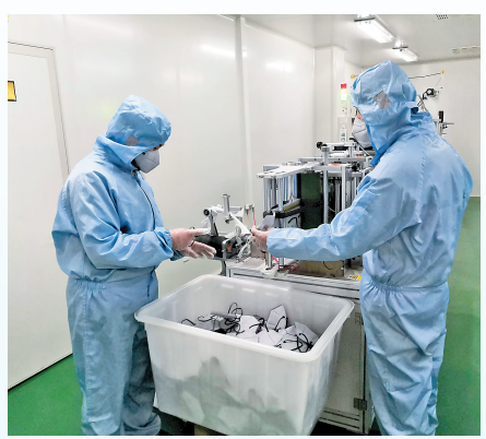
在荣翔生产车间,工人们正在全自动生产线上,加班加点生产口罩。