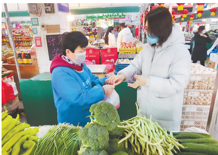
日前,开门营业的邢台市桥西第一菜市场,市场内菜品丰富,买卖双方防护到位,市民生活无忧。