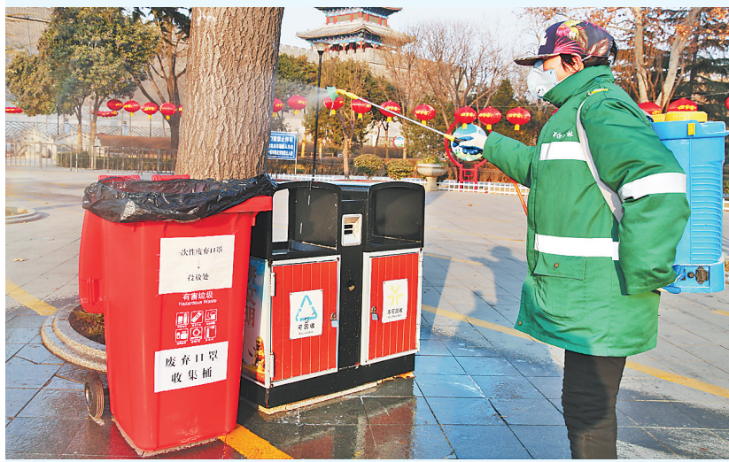
邢台市城管局环卫人员在历史文化公园对垃圾桶及其他部位进行消杀作业。

在邢台大街小巷及公共设施保洁消杀中,他们是主力;在市区出入口疫情排查一线上,他们和相关部门一起勇当担当;在城市供水、供热、供气、菜市场等监管一线,他们勇挑重担。 在抗击疫情的战斗中,为了市民生活平稳有序,邢台市城管系统广大干部职工不惧危险、迎难而上,迸发一股勇往直前的力量。