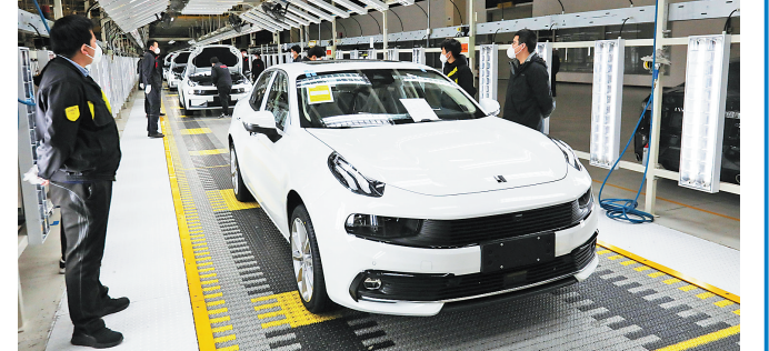
领克汽车张家口工厂复工后第一台整车下线。