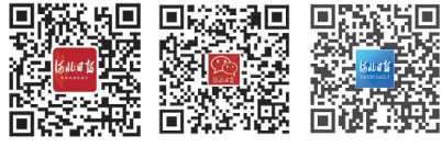
请关注河北日报微博、微信、客户端

新华社北京2月23日电 在藏历新年来临之际，中共中央总书记、国家主席、中央军委主席习近平2月21日给正在北京大学首钢医院实习的西藏大学医学院学生回信，肯定他们献身西藏医疗卫生事业的志向，勉励他们练就过硬本领、服务基层人民，并向他们以及藏区各族群众致以节日的问候和美好的祝愿。（下转第五版）