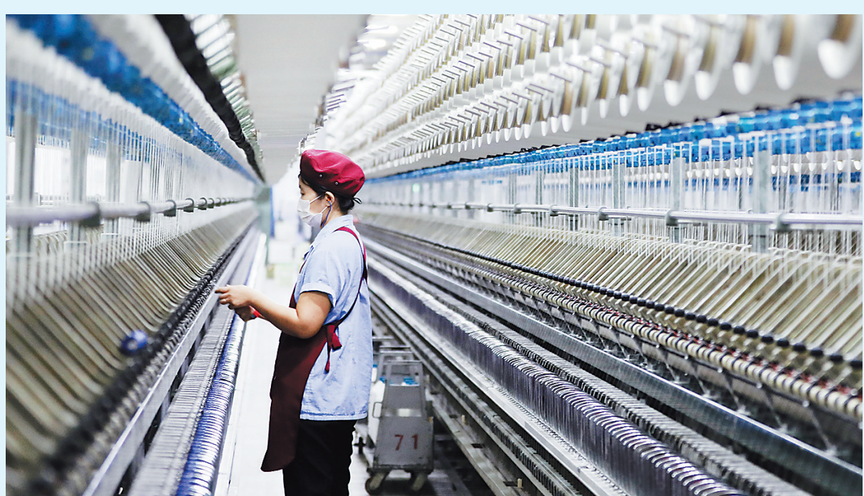
2月25日,位于衡水市桃城区的衡水纱线有限公司纺纱技术人员在生产线上忙碌。衡水市在做好疫情防控的同时,积极推动重点项目和企业有序复工复产。截至2月24日,该市规模以上工业企业已经有839家复工,复工率达到94.7%。

为做好复工期间疫情防控工作,项目专门成立了疫情防控小组,重点在严防输入上下功夫,不仅对工人进行全面体检,还规定工人的“行动轨迹”,确保防控“不留死角”。针对项目复工遇到的用工难、建设物资供应停工等难题,石家庄市发改委组织协调24家钢结构和砂浆生产企业复工复产,保障项目物资供应;协调市直相关部门调拨防护用品及消杀用品,满足项目防疫需要。井陘矿区围绕项目建设需要的水、电、气、路等重点工程,全力配合搞好服务,已为项目招聘当地工人600余人,协调5家搅拌站为项目提供混凝土。