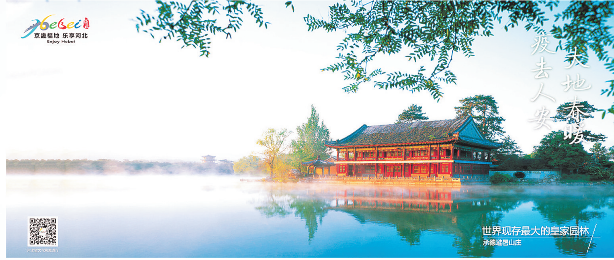
省文旅厅通过厅办新媒体平台推出“大地春暖 疫去人安”系列屏保。

新冠肺炎疫情发生以来，河北省文化和旅游系统全面落实党中央、国务院和河北省委、省政府决策部署，迅速行动，完善机制，上下联动，多措并举，坚决打好疫情防控阻击战。从全面关停文旅场所、暂停文旅活动到丰富在线文旅产品、创作抗疫文艺作品，从严守防疫关口、苦练行业内功，到谋划疫情后行业发展、科学有序复工复产，河北文旅奋力夺取防疫和发展“双胜利”。