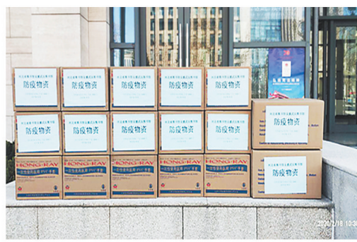
河北省图书馆支援武汉图书馆的防疫物资。