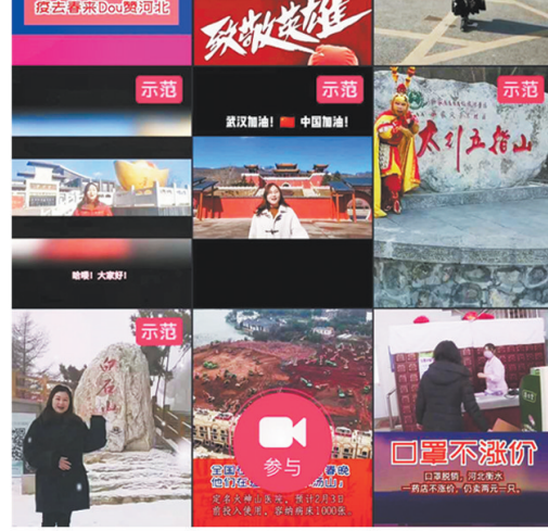
省文旅厅发起“疫去春来”抖音挑战赛，相关视频播放量超过1.9亿次。