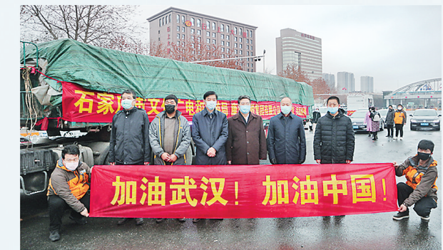
2月14日，由石家庄市文广旅局和康辉集团共同筹集的一批防疫用品和生活物资运往湖北武汉。

防疫抗疫工作开展以来，河北省文化和旅游厅高度重视发挥舆论宣传的重要作用，统筹协调全省文旅系统积极开展文艺创作，组织发动文旅融媒体群创新在线