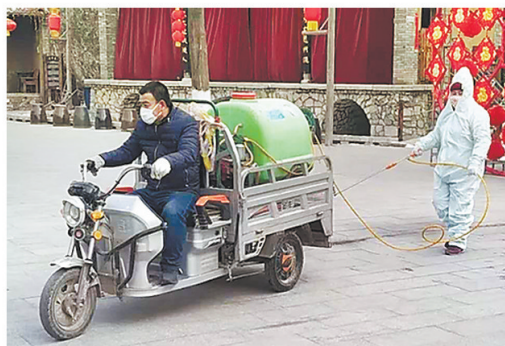
太行水镇工作人员在园区内部喷洒消毒液。