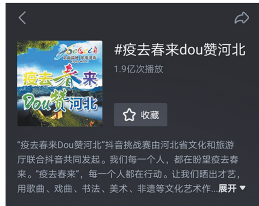
“疫去春来Dou赞河北”抖音挑战赛由河北省文化和旅游厅联合抖音共同发起。我们每一个人，都在盼望疫去春来。“疫去春来”，每一个人都在行动。让我们晒出才艺，用歌曲、戏曲、书法、美术、非遗等文化艺术作“展开”