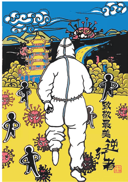
武强木版年画《最美逆行者》。作者：耿雅雯