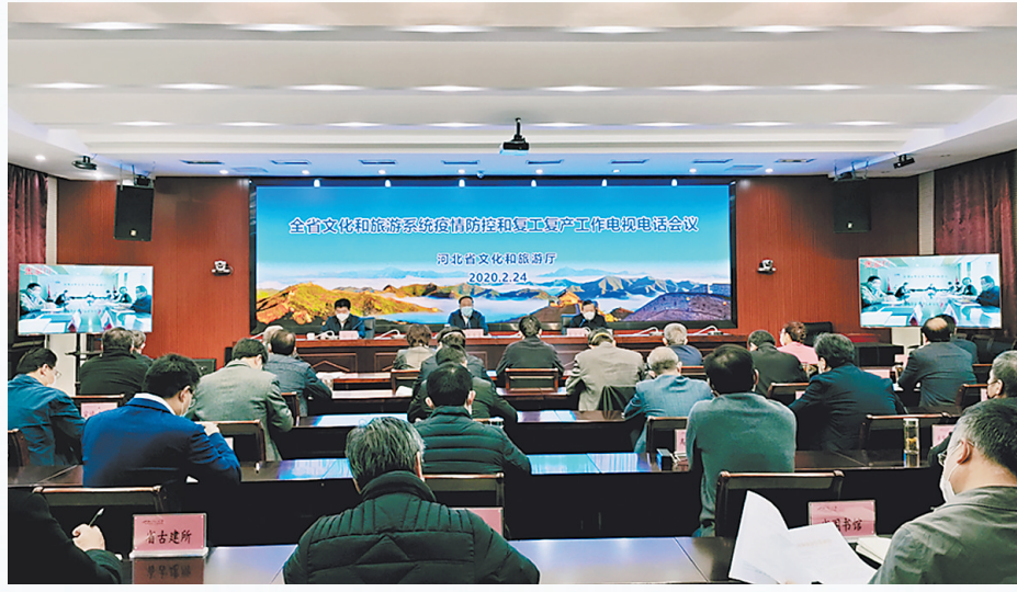
2月24日，省文旅厅召开全省文化和旅游系统疫情防控和复工复产工作电视电话会议。

北省文化和旅游厅联合学习强国河北平台，并通过文旅新媒体矩阵开设“云游河北”系列专题，推出了数字博物馆、数字图书馆、免费听书、行走长城、探索有故事的河北、网上非遗、网上逛中国世界遗产等线上文旅视听内容。还与河北广播电视台交通广播联合推出“动听河北”节目，每天连线一位旅游达人，讲述河北文化旅游故事。并在抖音平台发起“疫去春来”抖音挑战赛，截至目前，相关视频播放量超过1.9亿次，积聚人气、鼓舞士气，强信心、暖人心、筑爱心。