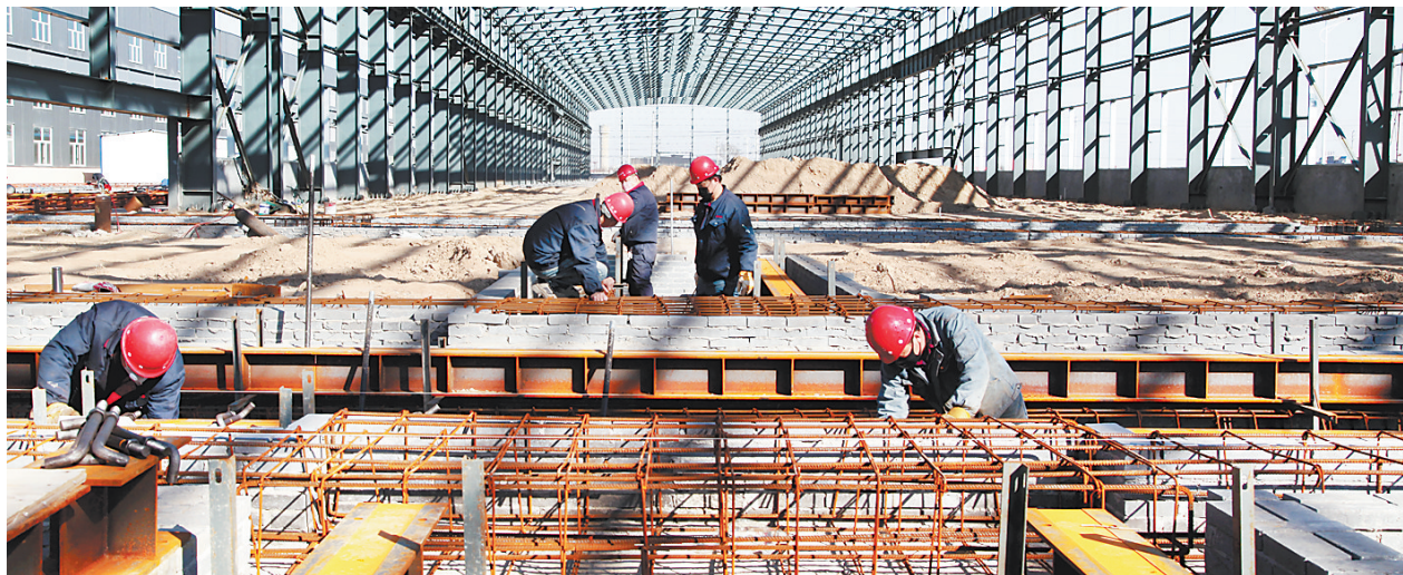
▲近日,在沧海核装备科技股份有限公司高耐腐蚀化工管项目车间施工现场,施工人员进行设备安装基础施工作业。

为推动各企业有序复工复产,献县制定了一系列政策措施,给企业安全上了多重保险,确保生产安全、有序进行。