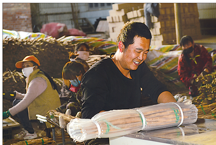
←滞销的麻山药卖出去了,村民的脸上满是笑容。