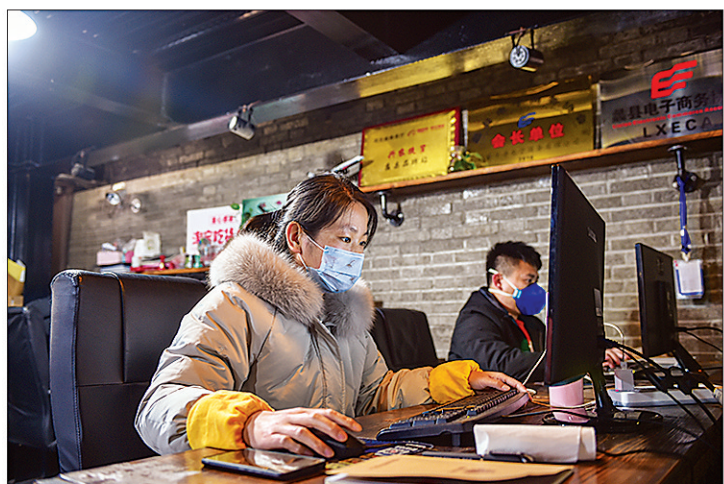
←3月10日, 蠡县电商客服人员正在紧张工作。这些日子,为了将当地麻山药及时售出,他们经常加班到深夜。