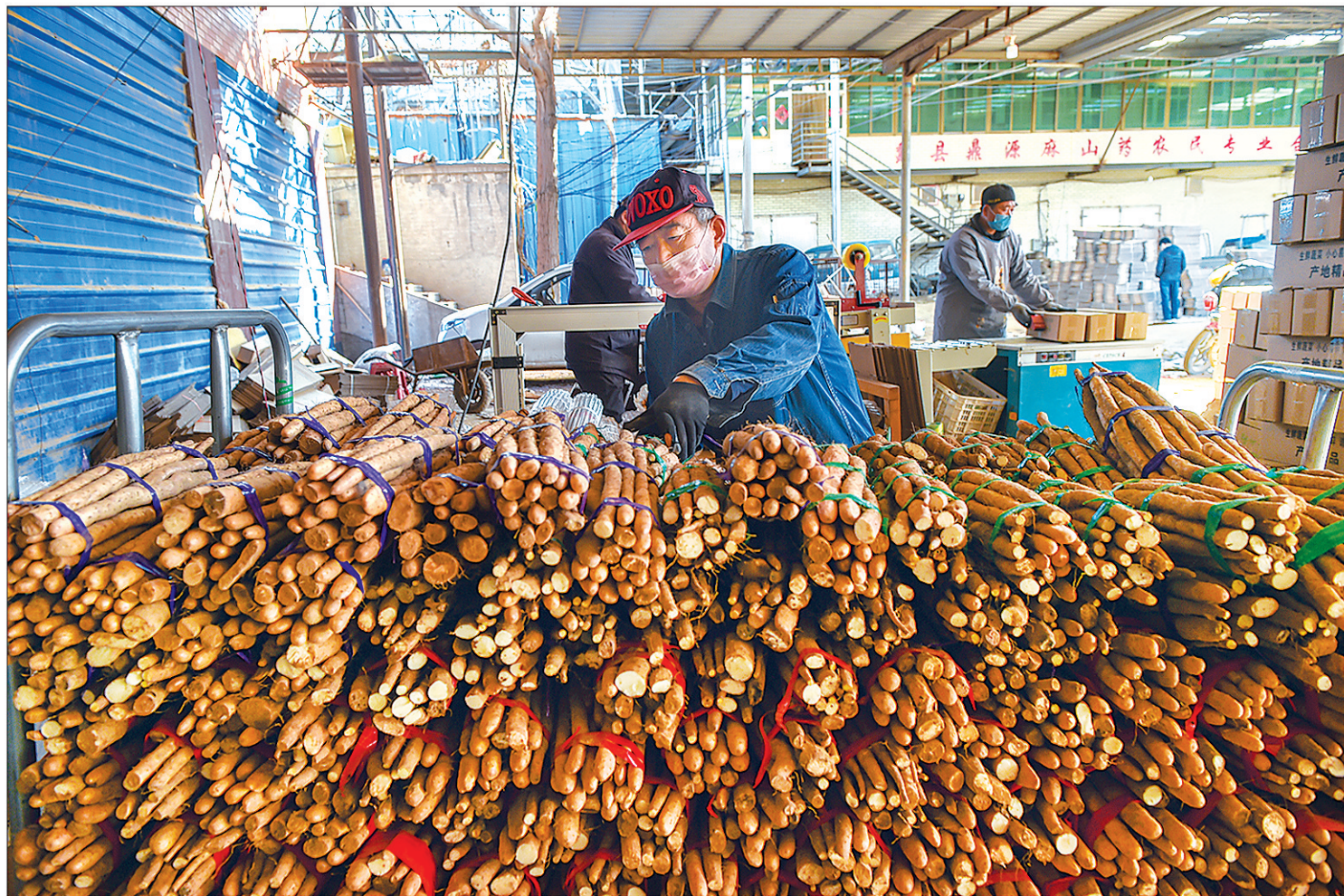
←3月10日,蠡县大曲堤镇村民分装打包麻山药。