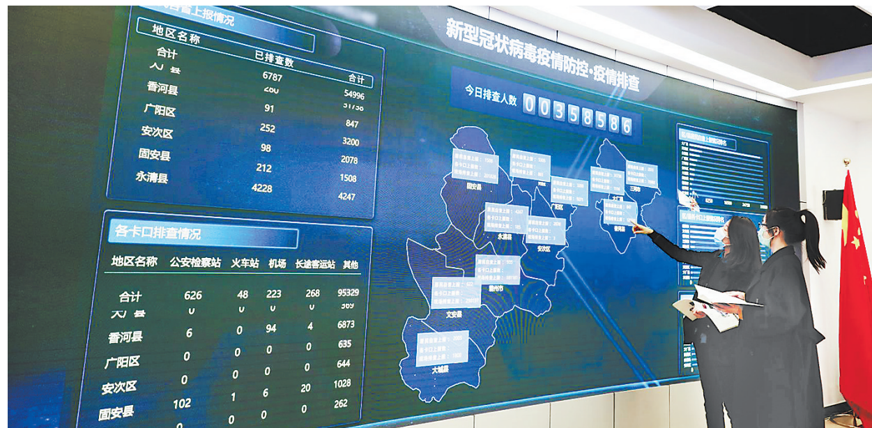
在廊坊市卫生健康信息中心的“健康廊坊—疫情防控筛查系统”上,疫情排查数据在这里进行汇总分析。

早在2012年,廊坊市卫健委就着手建设“一云四端”与“互联网+精准健康照护”模式的信息化体系建设。立足高标准、高起点,在汲取各地成功经