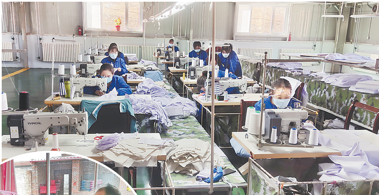
▲近日，在怀安县左卫镇北高家窑村扶贫车间内，工人们正在加工服装。

张家口作为全省脱贫攻坚的主战场，全市仍有1.2万贫困人口未脱贫，占全省剩余3.4万未脱贫退出贫困人口的35.3%。