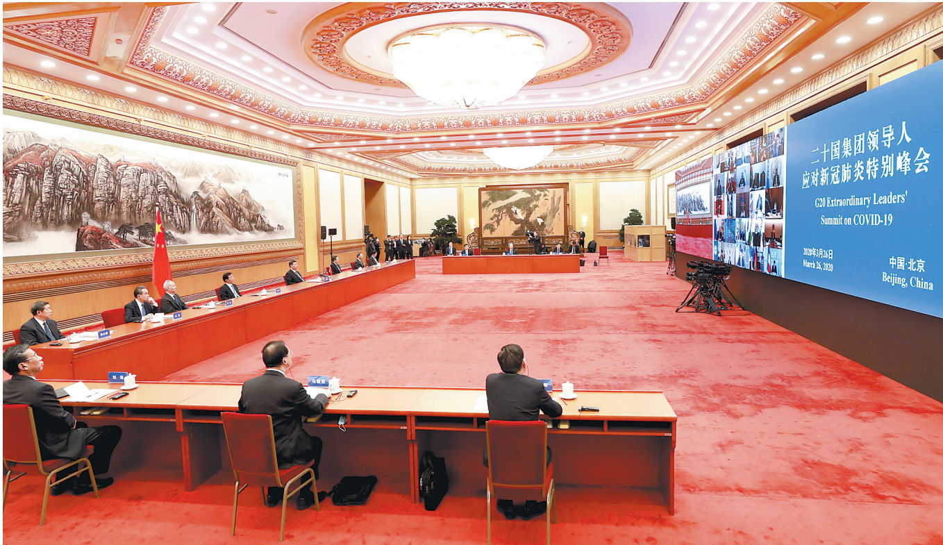
3月26日，国家主席习近平在北京出席二十国集团领导人应对新冠肺炎特别峰会并发表题为《携手抗疫 共克时艰》的重要讲话。